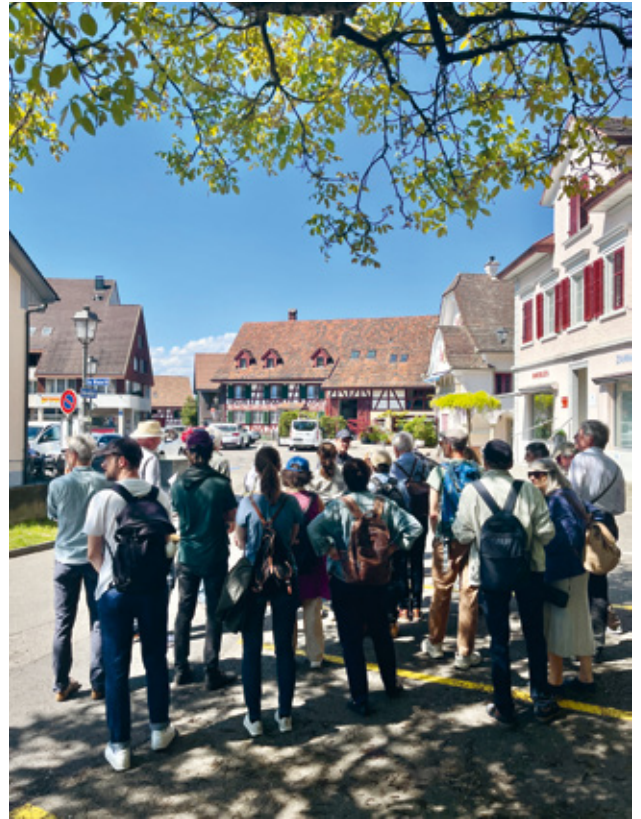
4 Führung in Andelfingen