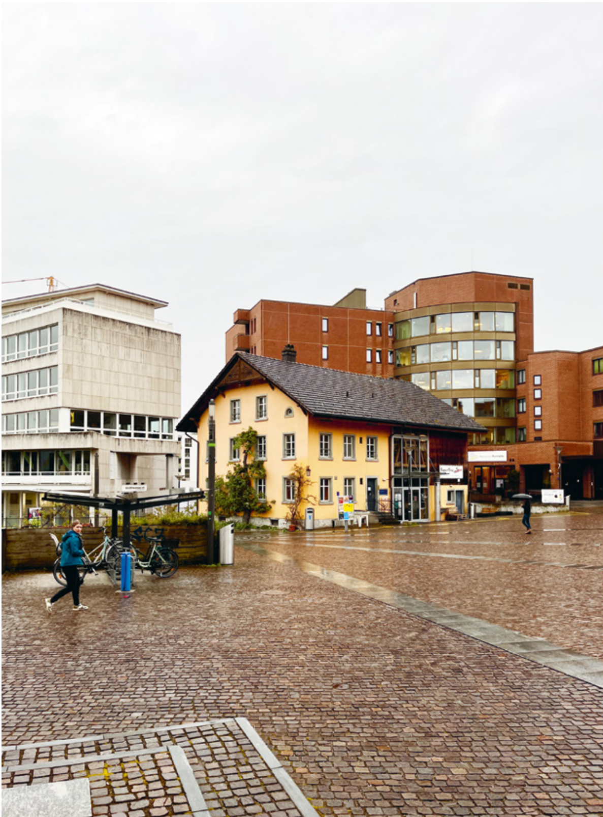
2 Auf den Spuren der Effretiker Zentrumsentwicklung führte Werner Huber bei Regen durch den Ort.