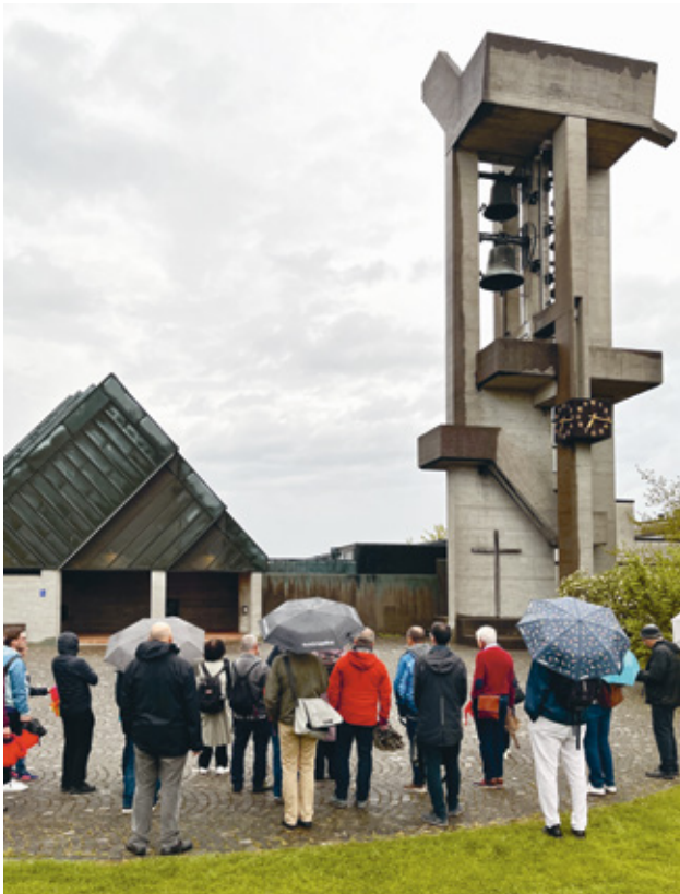
3 Führung in Effretikon