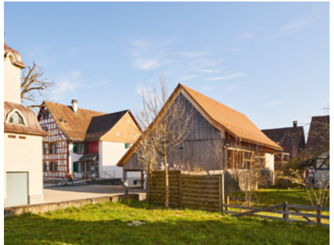
12 Küblerscheune in Ossingen mit Kontext