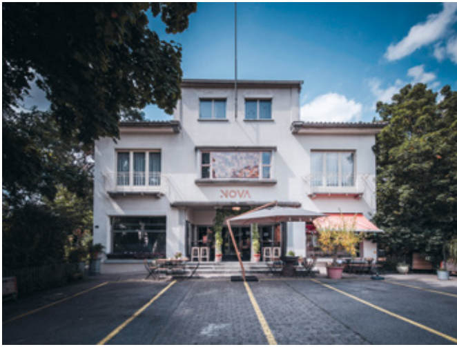
17 Kino Rex, Pfäffikon