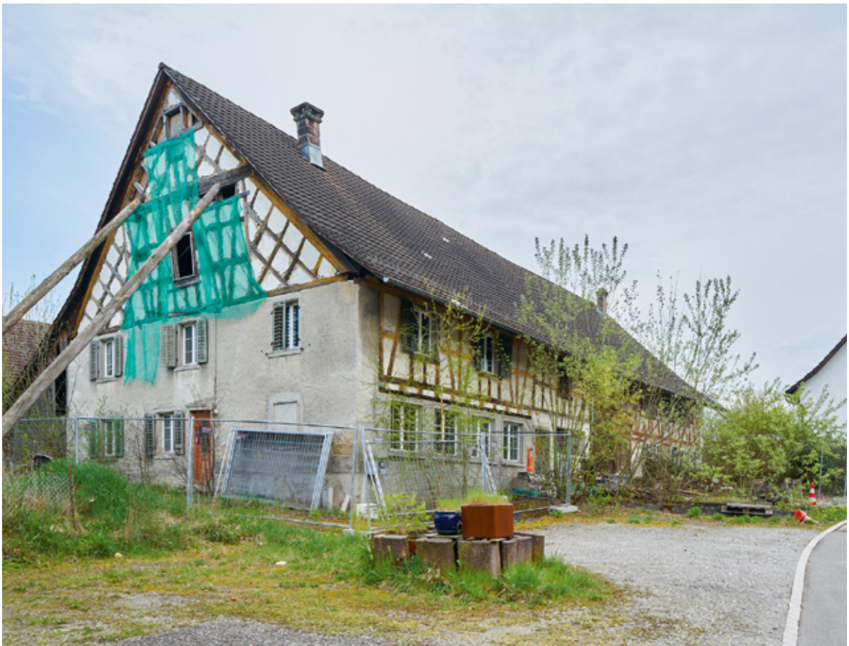
16 Vielzweckbauernhaus in Oberglatt