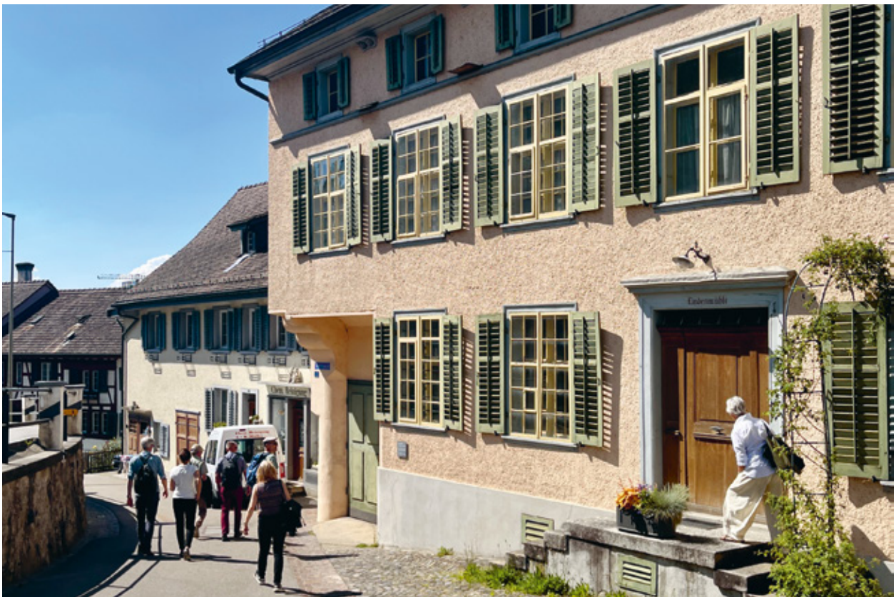
5 Ortsentwicklung am Agglomerationsrand war das Thema der Exkursion nach Andelfingen.