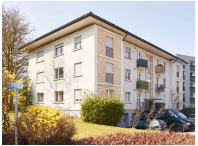
18 Mehrfamilienhaus in Tagelswangen