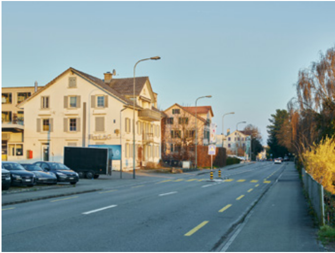
14 Villa an der Seestrasse in Männedorf