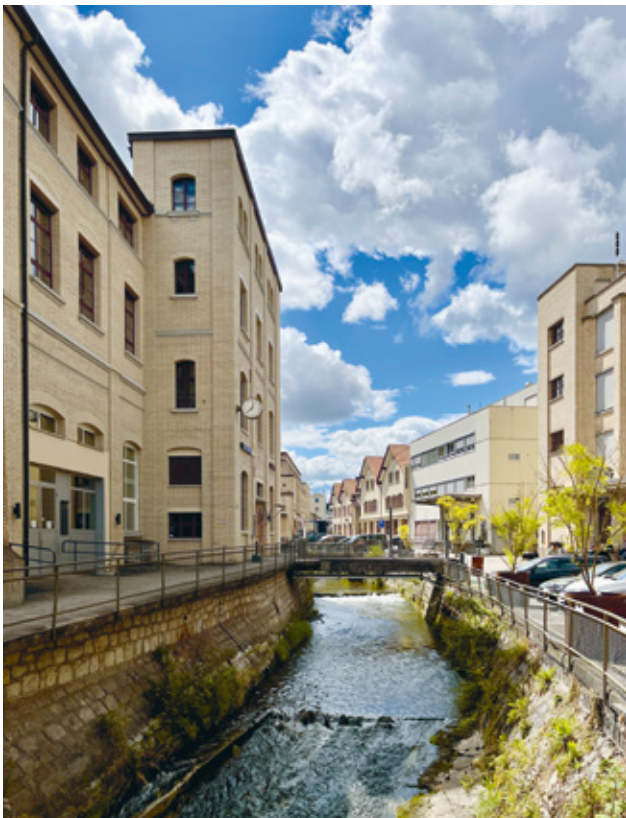
8 Führung in Kemptthal