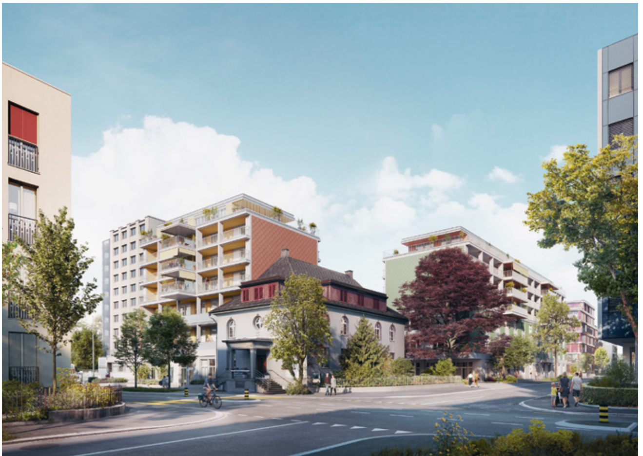
19 Visualisierung des angepassten Neubauprojekts unter Erhalt der Église française