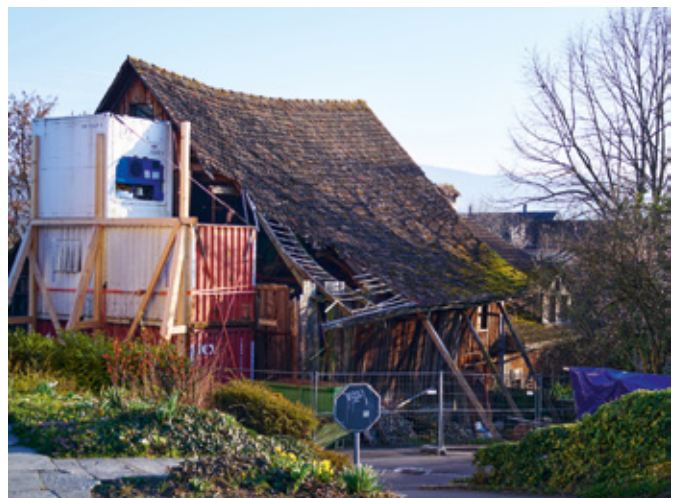
13 Scheune in Männedorf