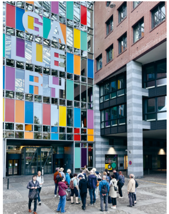
9 Führung zur Postmoderne in Opfikon mit Cyril Kennel