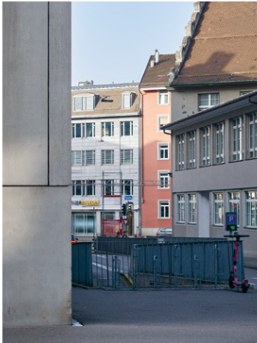
10 Altstadt Winterthur, Luftbild von 1951 11 Im Hintergrund das rote Gebäude Technikumstrasse 90 am Rand der Winterthurer Altstadt