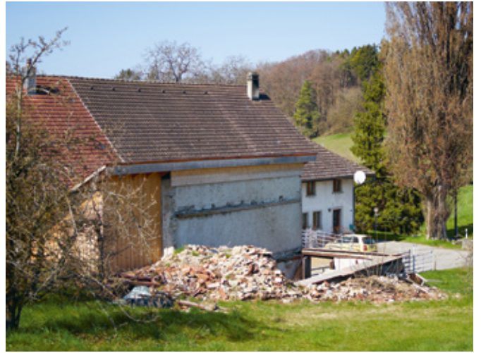
15 Reste des Speichers, Trinenmoos