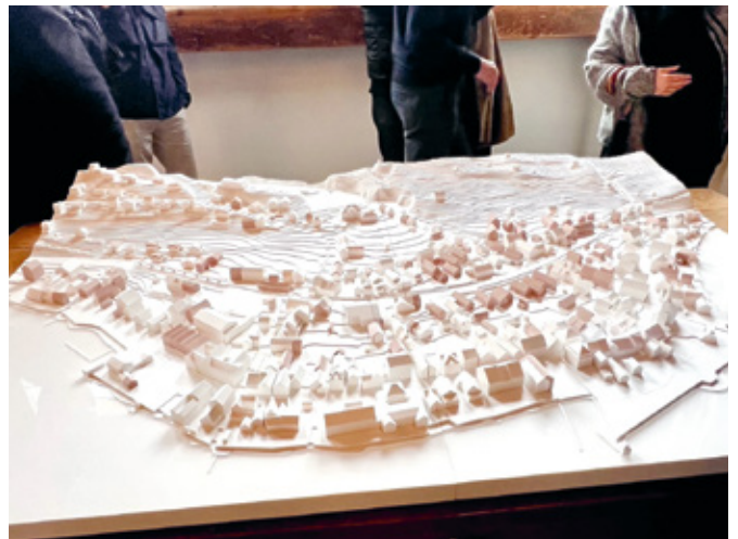
22 Zu Gast in Berlingen: dem ISOS in der Ortsentwicklung auf der Spur.